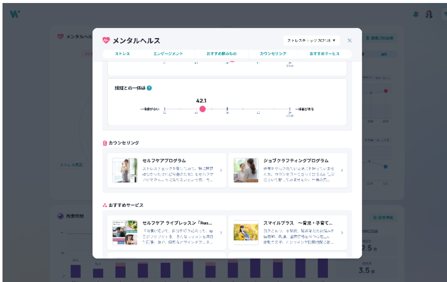
※従業員向け「ダッシュボード」イメージ