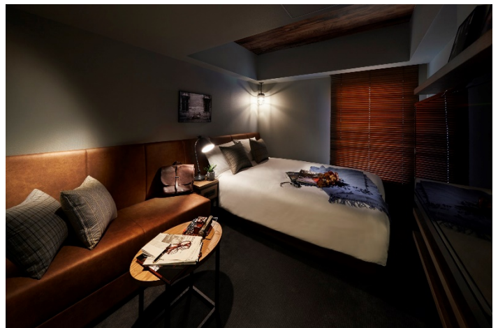
客室（モダレットルーム）